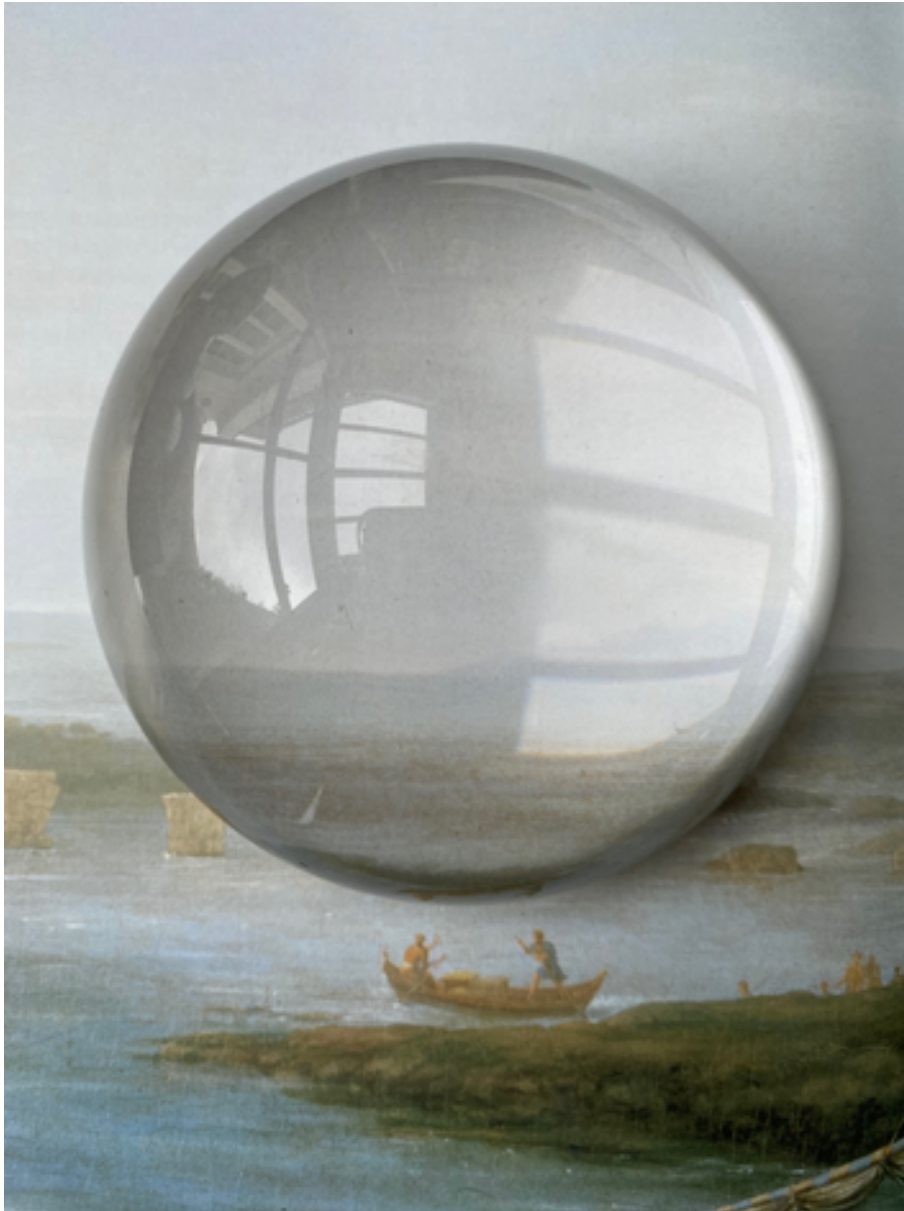
Apesante image, Ambassade . Impression sur papier Canson . 30X40cm. 2023