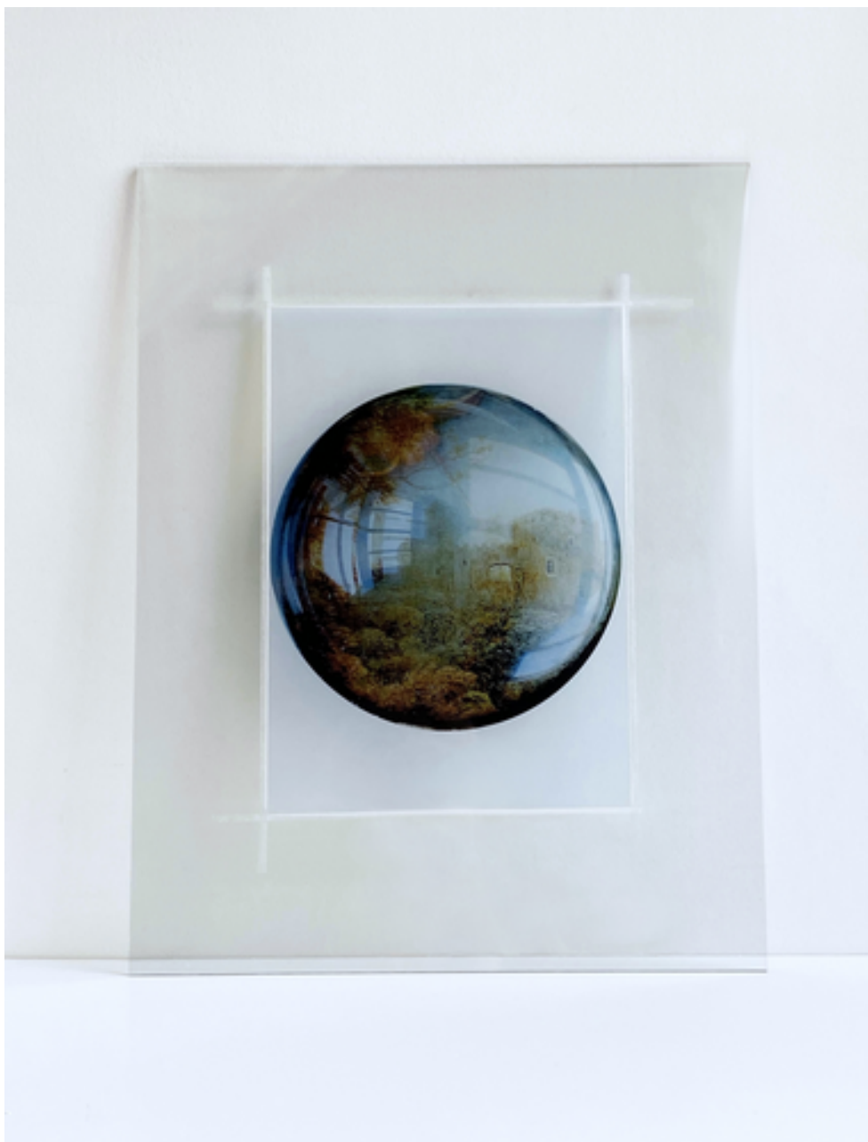
S'abstraire, Les bois : Impression sur polyester , plaques de verre et scotch. 38X48cm . 2023